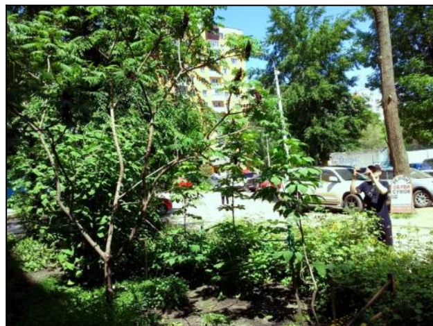
Рис. 3. Фотографирование сумаха пушистого на придомовом участке