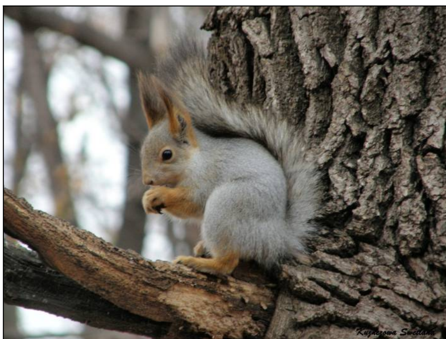
Рис. 12. Белка в зимнем наряде