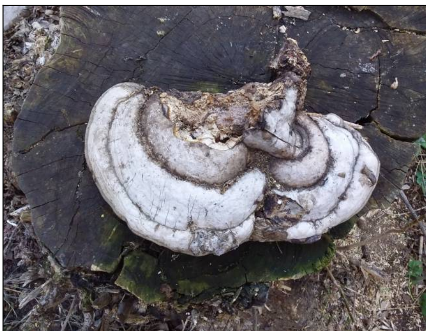
Рис. 8. Трутовик обыкновенный (копытень)