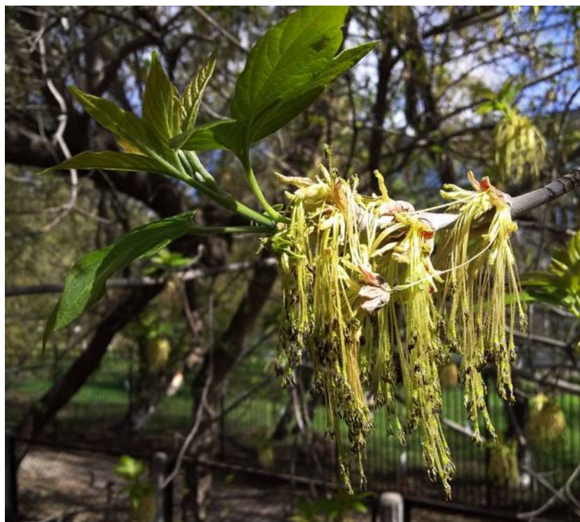
Рис. 7. Ветроопыляемый клён американский