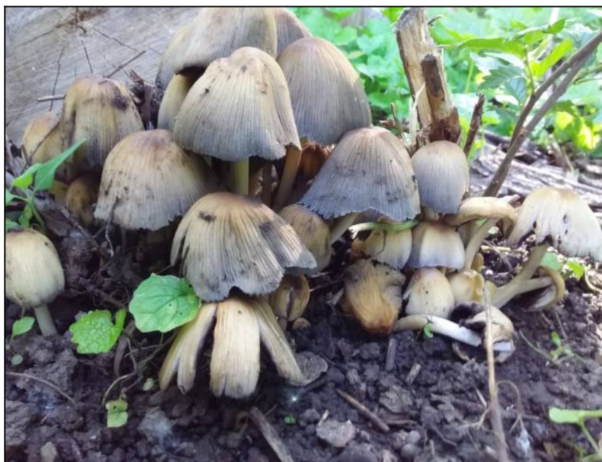
Рис. 9. Навозник обыкновенный