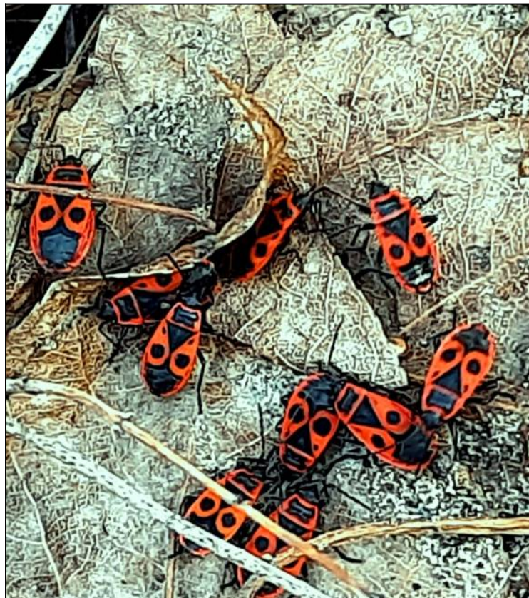
Рис. 14. Клопы солдатики