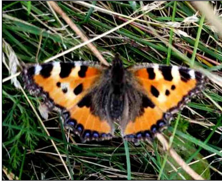
Рис. 15. Бабочка крапивница