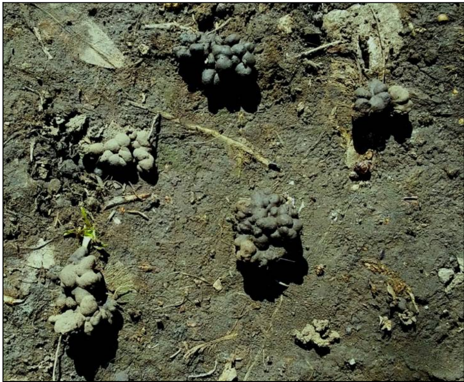
Рис. 13. Копролиты земляных червей