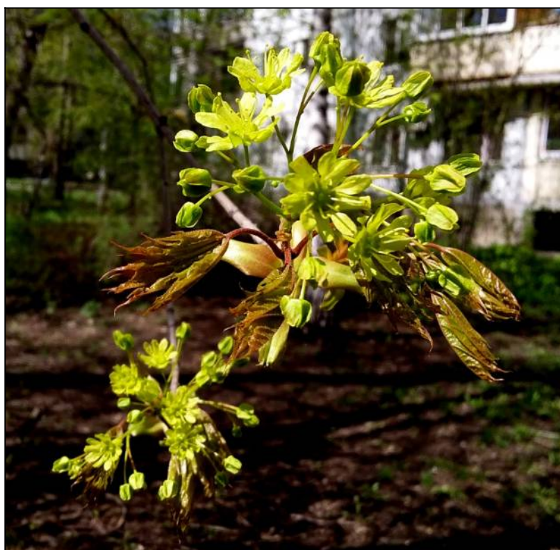
Рис. 6. Медонос клён остролистный