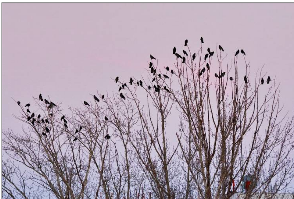
Рис. 11. Ворóны на ночёвке