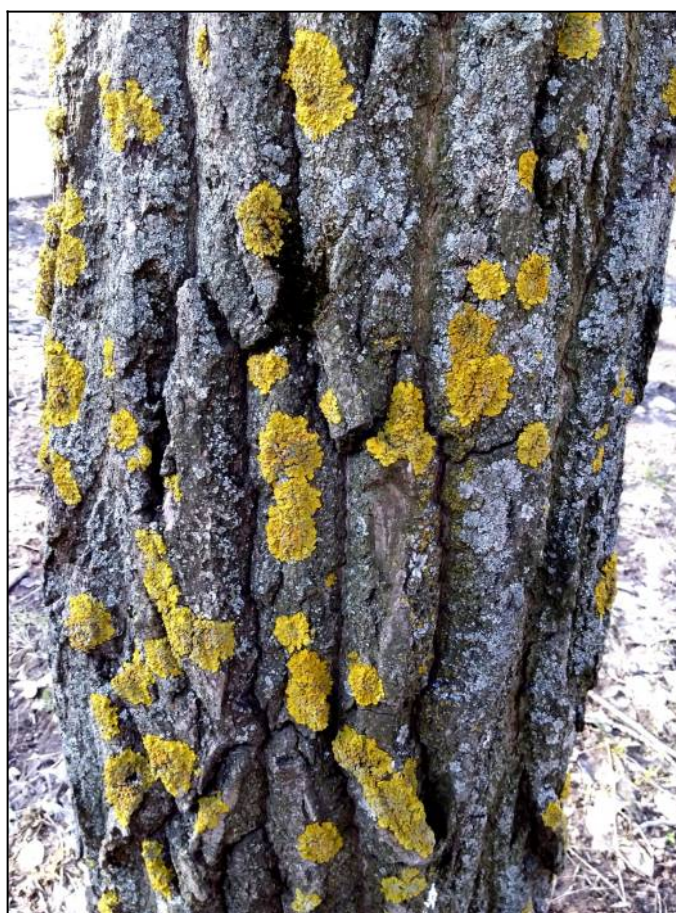
Рис. 10. Ксантория настенная и пармелия бороздчатая