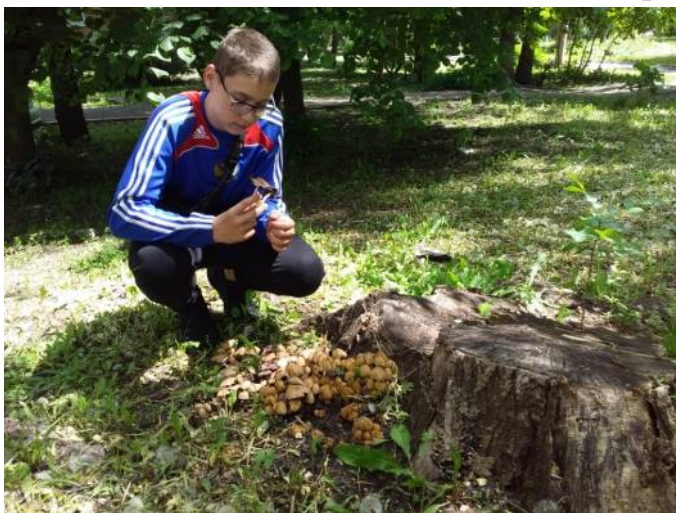
Рис. 9. Осмотр скопления грибов навозников обыкновенных

Грибы играют очень важную роль в поддержании экосистемы в равновесном состоянии. Сами они не могут наподобие зелёных растений синтезировать органические вещества. Но, наряду с бактериями, грибы с помощью своих ферментов могут разлагать сложные органические молекулы до простых неорганических соединений. В результате происходит обогащение почвы растворимыми солями, содержащими азот, фосфор и калий – химические элементы, необходимые для развития и роста растений. Оплетая корни деревьев гифами грибницы, грибы-микоризообразователи получают от деревьев необходимые для своего роста и развития питательные растворы органических веществ. Возникает взаимопольное для деревьев и грибов сожительство - симбиоз. Грибы-трутовики (Рис. 8), наоборот, разрушают древесину, расщепляя полимерные молекулы целлюлозы до более простых органических молекул. А почвенные грибы, не связанные напрямую с деревьями, переводят омертвевшие органические остатки (детрит) в растворимые неорганические соединения, повышая плодородность почвы.