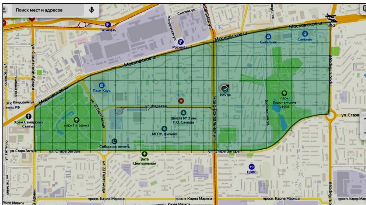
Рис. 2. Территория исследования

Выбранный городской участок расположен в границах проспекта Советской Армии, ул. Стара-Загора, проспекта Кирова, Московского шоссе (Рис. 2). В Самарской области географически он является частью водораздельного плато пойм рр. Волги и Самары на границе степной и лесостепной природно-географических зон (Ясюк, 2016).